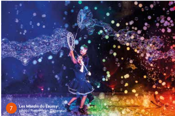
7 Les Mardis du Laussy