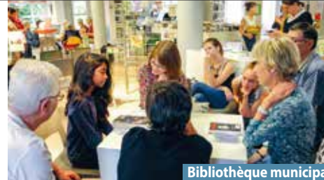
Bibliothèque municipale François-Mitterrand

Vous souhaitez rester informé de l'actualité culturelle ? Inscrivez-vous sur notre liste de diffusion en écrivant à laussy@gieres.fr