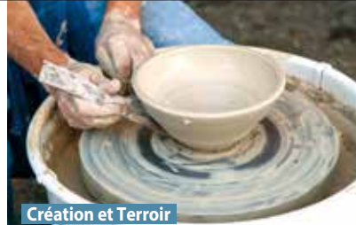
Création et Terroir