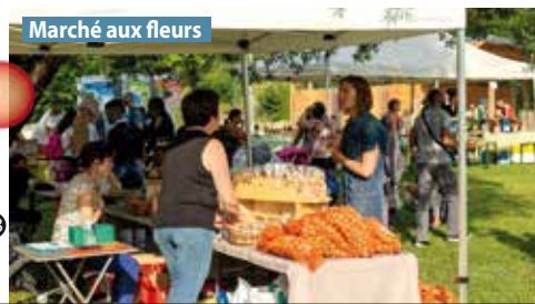
Marché aux fleurs

Renseignements : 04 76 89 69 12 - laussy@gieres.fr - ville-gieres.fr Parc Michal - Accès libre