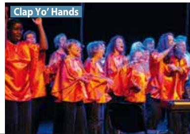
Clap Yo' Hands