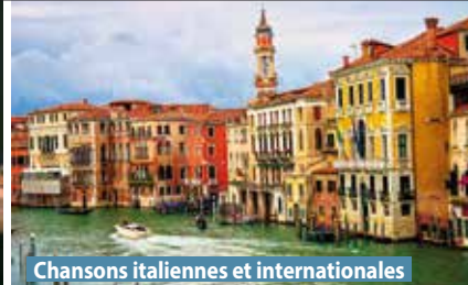
Chansons italiennes et internationales