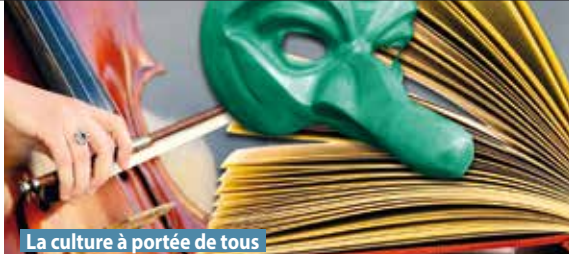
La culture à portée de tous