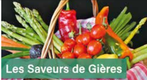
Les Saveurs de Gières