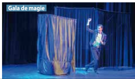
Gala de magie

Le concert reprend les succès des grands chanteurs de cette époque, tels que Nat King Cole ( Unforgettable ), Frank Sinatra