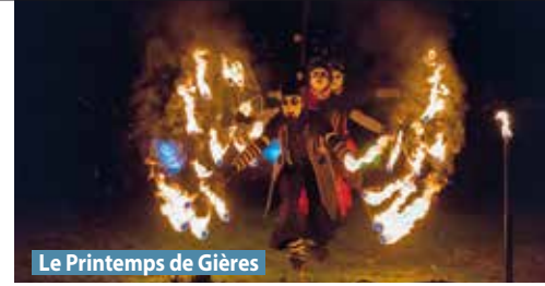
Le Printemps de Gières