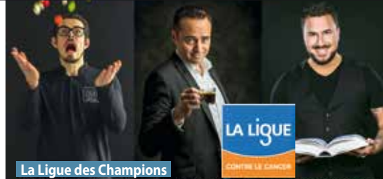
La Ligue des Champions