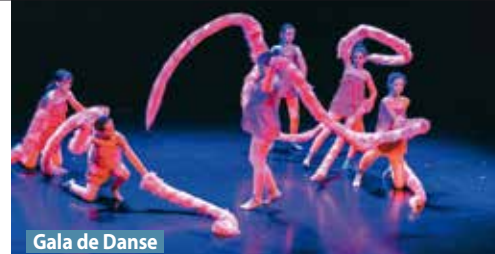
Gala de Danse