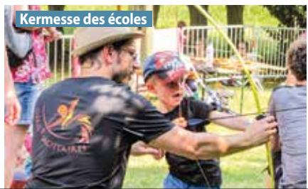
Kermesse des écoles

La kermesse est organisée par l'association du Sou des écoles laïques de Gières et les parents d'élèves.