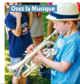
Osez la Musique