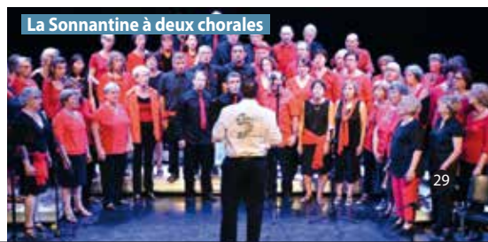
La Sonnantine à deux chorales

Parc Michal et grange Michal - Accès libre