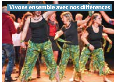
Vivons ensemble avec nos différences