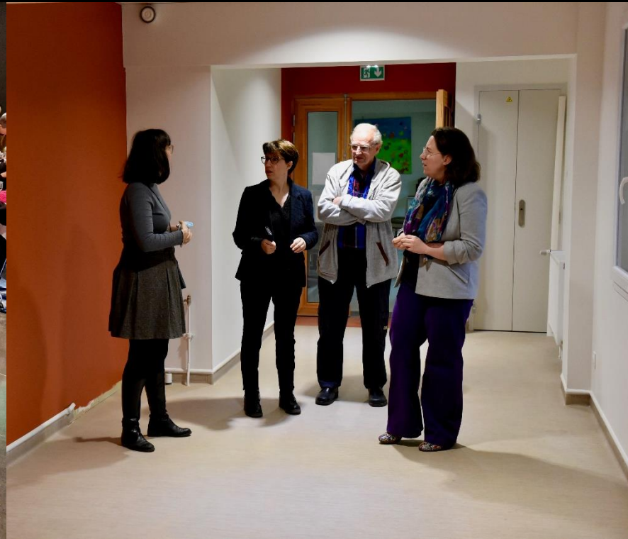
Travaux de rénovation à la résidence Roger-Meffreys