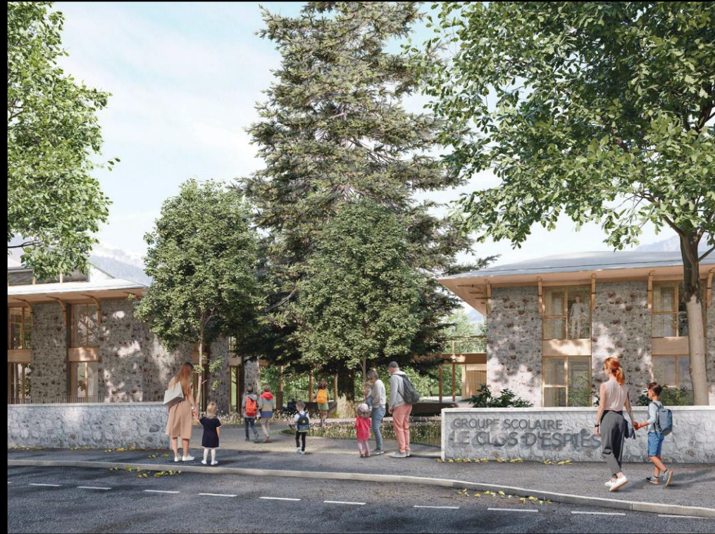
Futur groupe scolaire