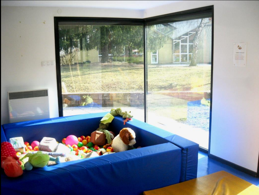
Crèche des Lithops (avant)