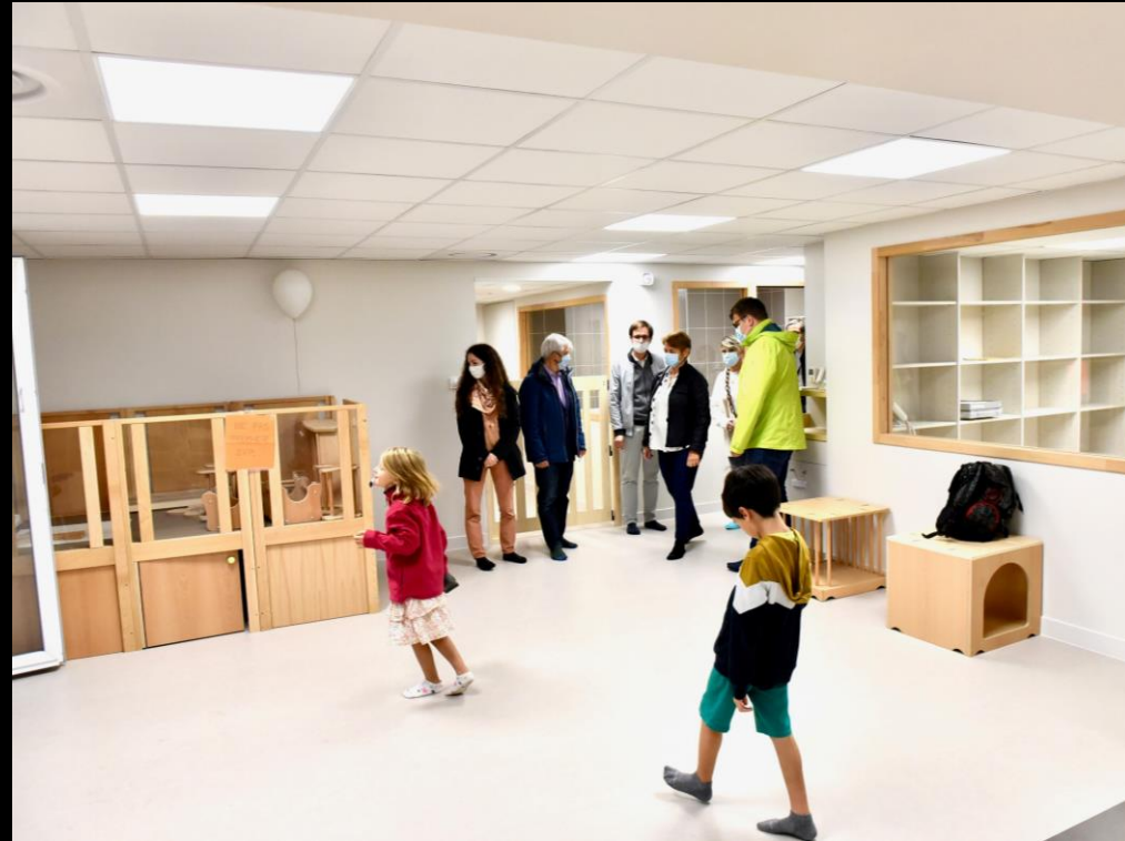
Crèche des Lithops (après)