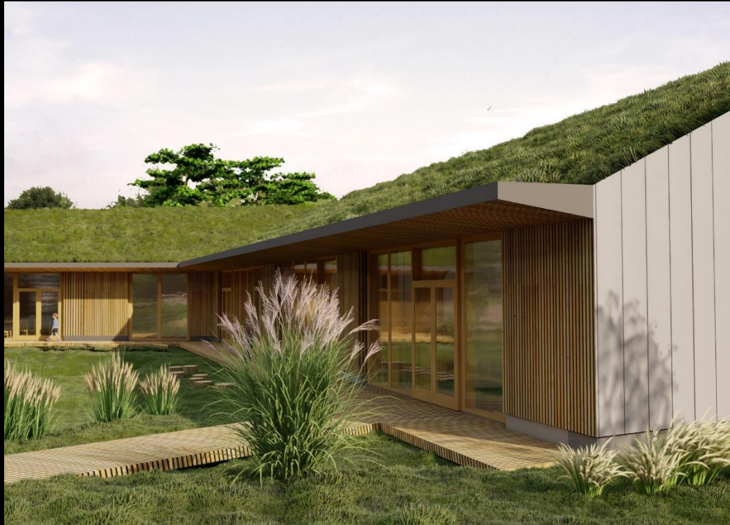
Futur restaurant scolaire