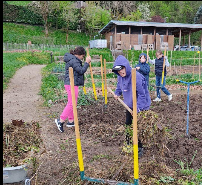
Projet « carte citoyenne »