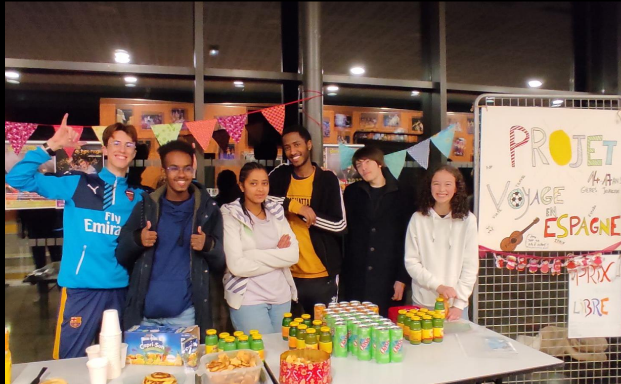
Projet de loisirs (voyage à Barcelone)