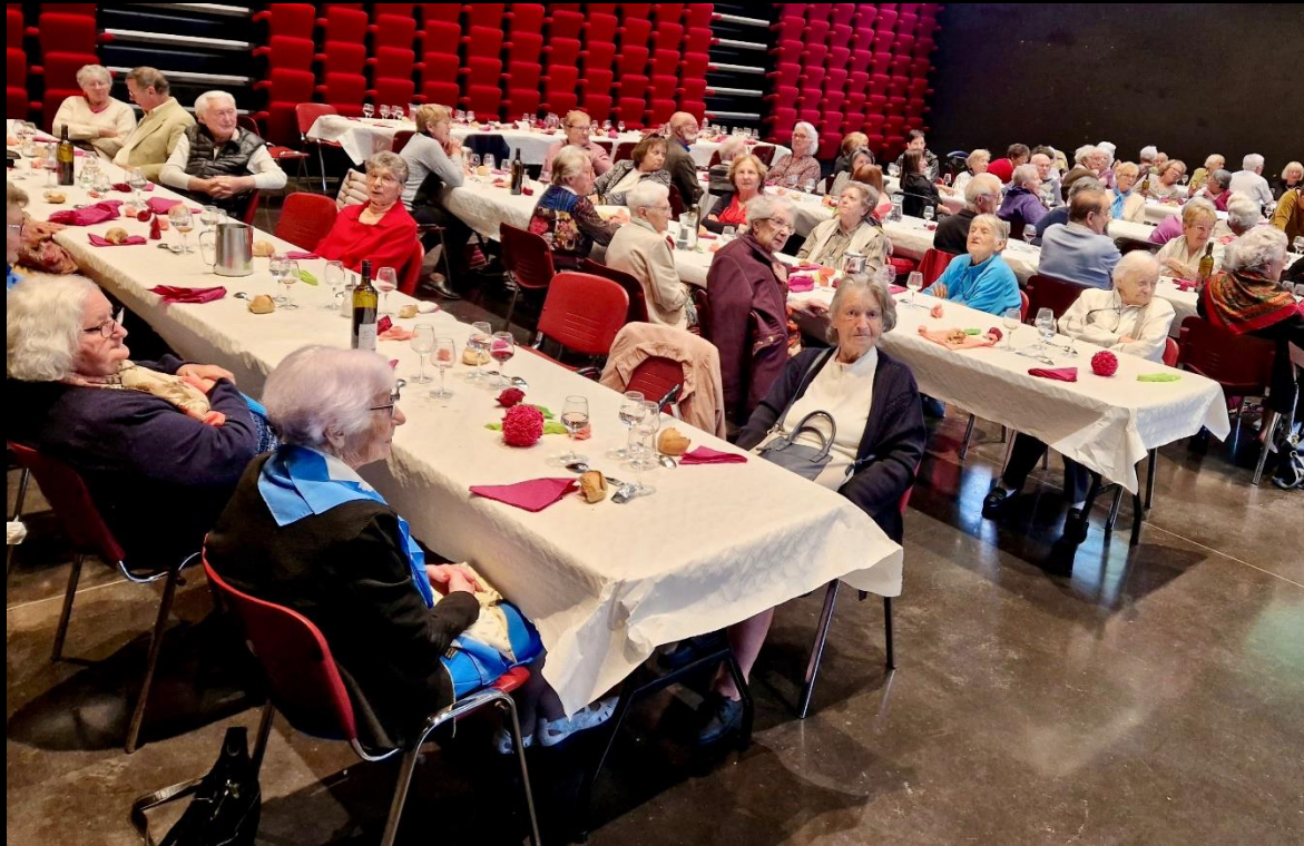
Repas de « printemps »